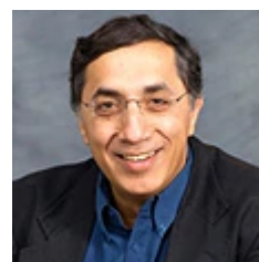
שם את המפתחות. פרופ' דניאל לוי